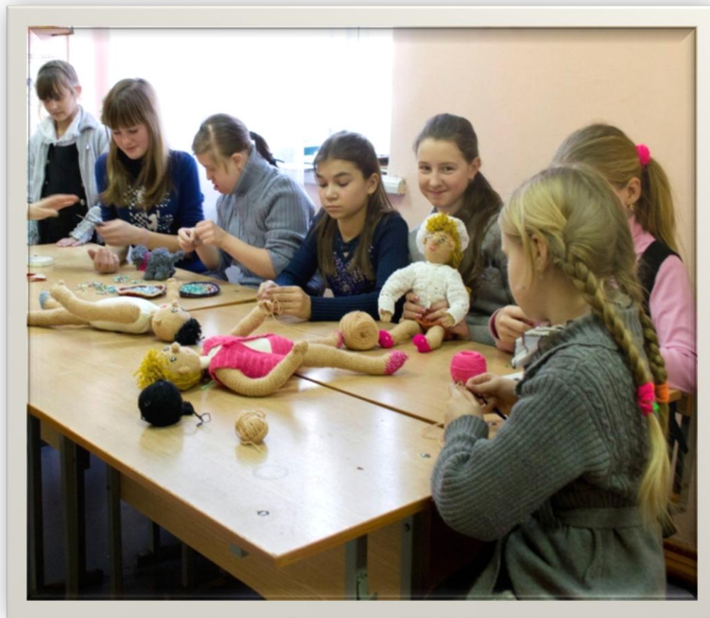
Вязание крючком костюмов для кукол