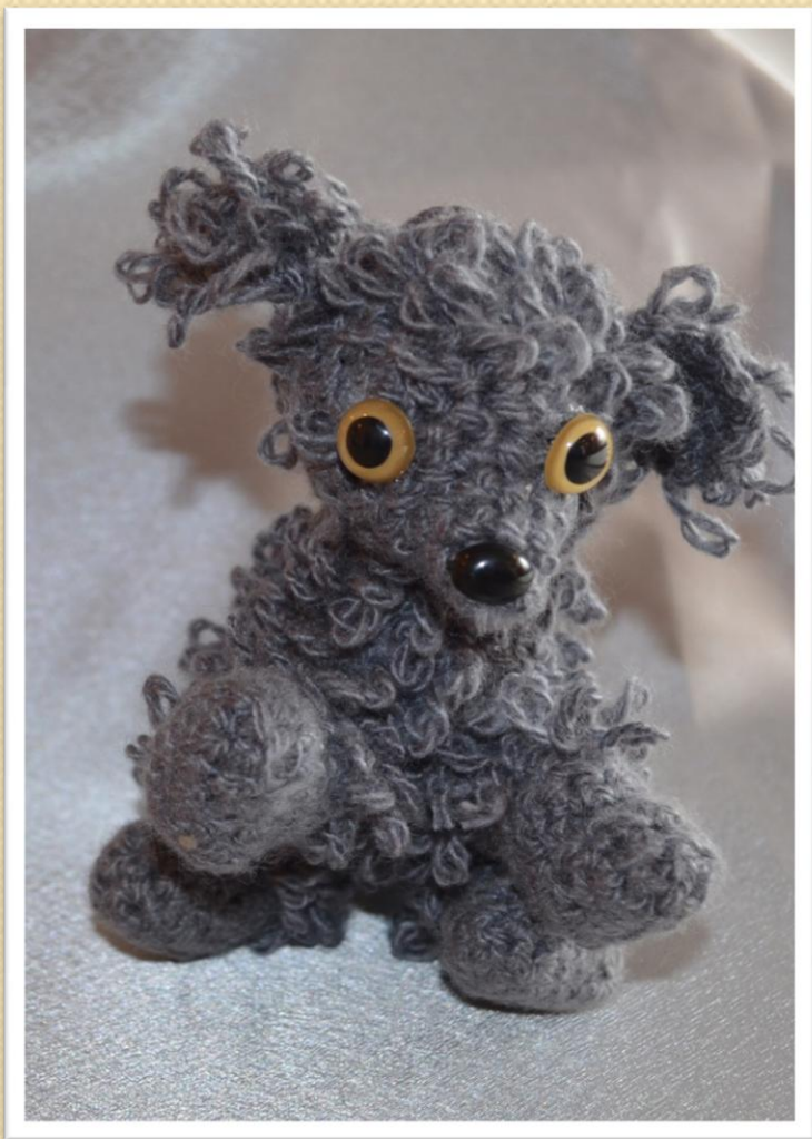
Друг семьи – собачка по имени «Дружок»!