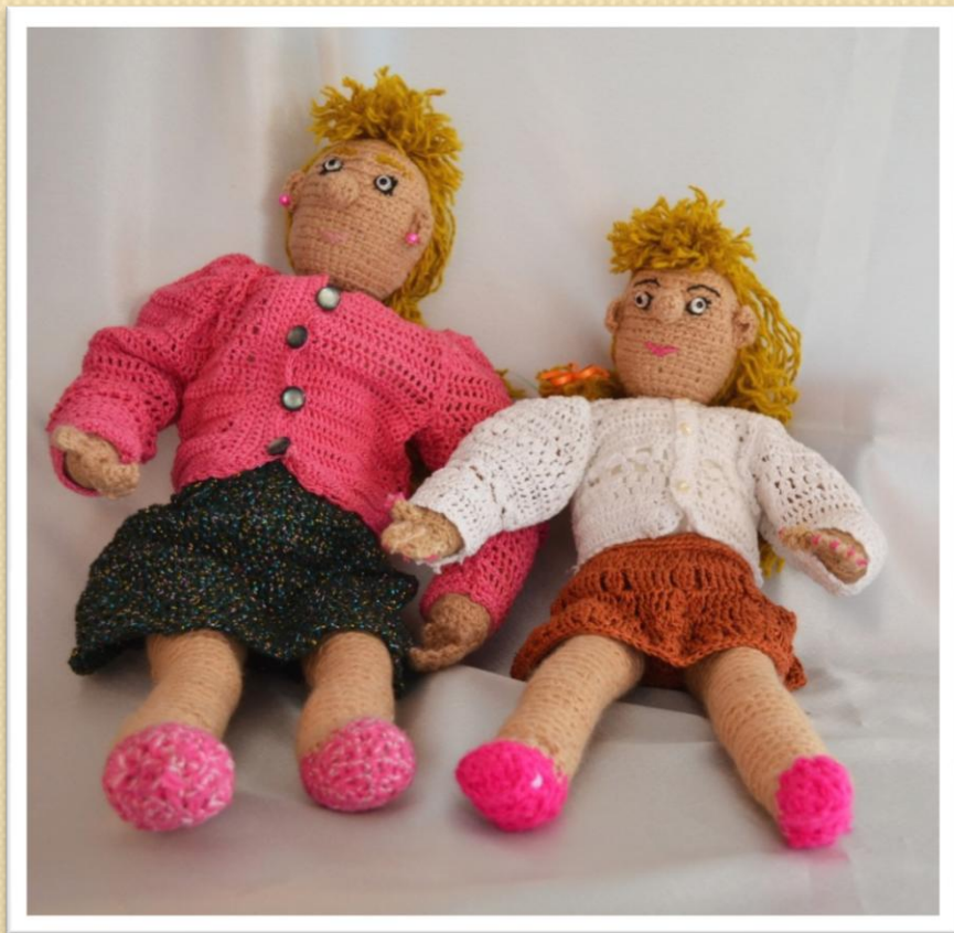
Куклы : мама и дочь