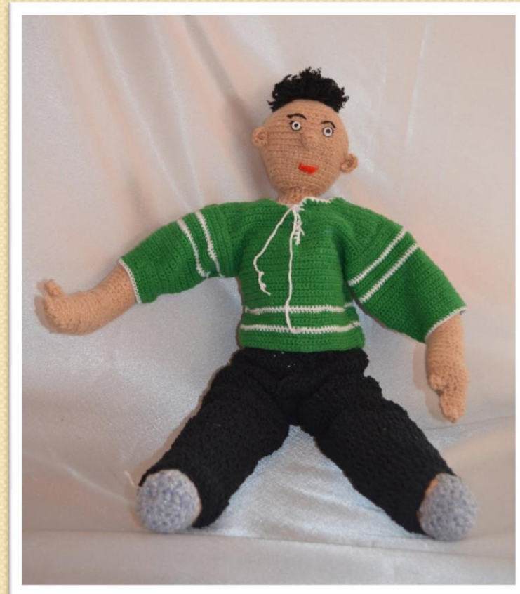
Кукла - сын