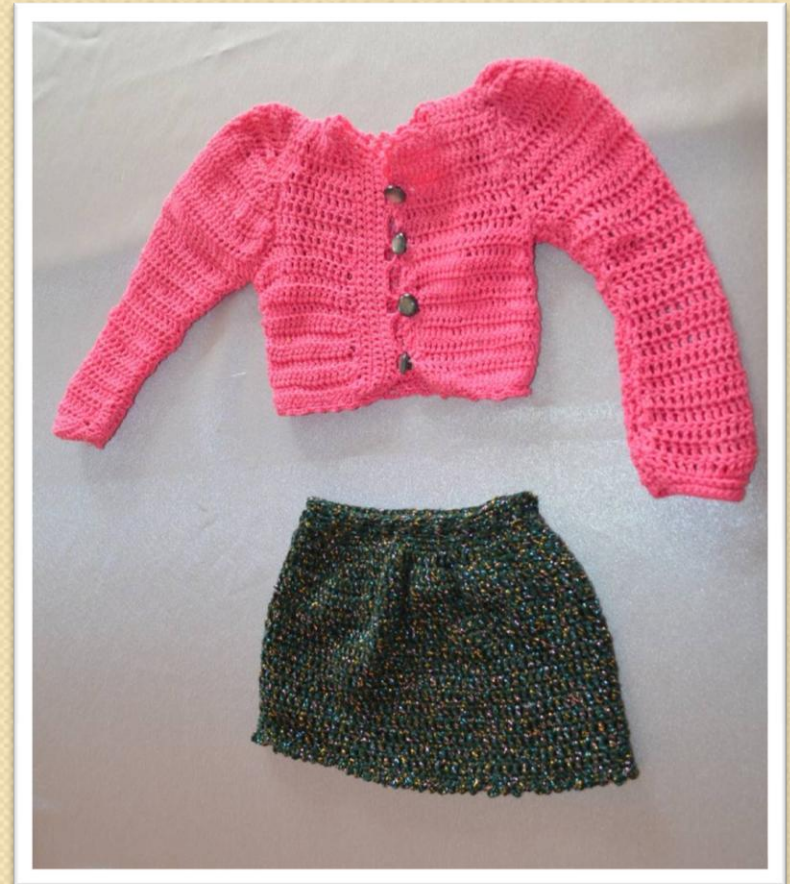
Костюм для куклы - мамы