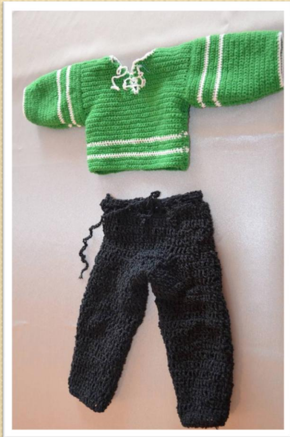
Костюм для куклы - сына