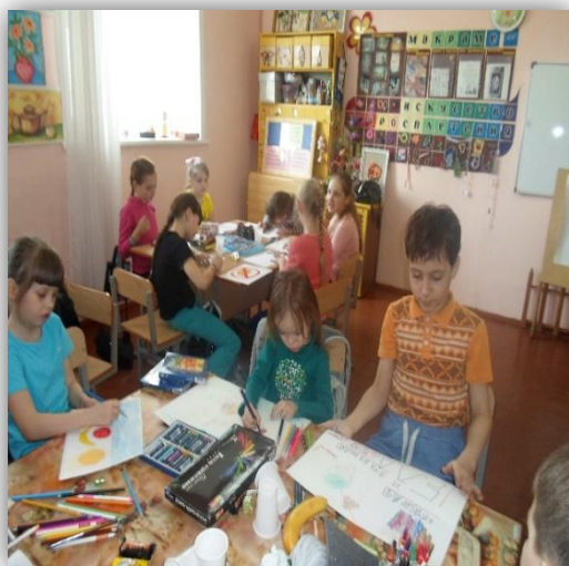
Подготовка к спортивному празднику