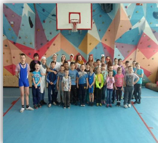
Участники спортивного праздника