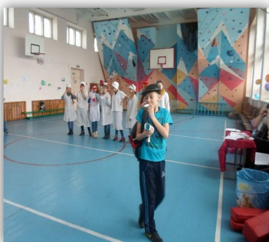
Сценка о вредных привычках