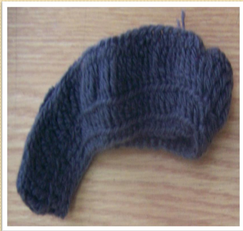
Вязаная гусеница для корпуса танка