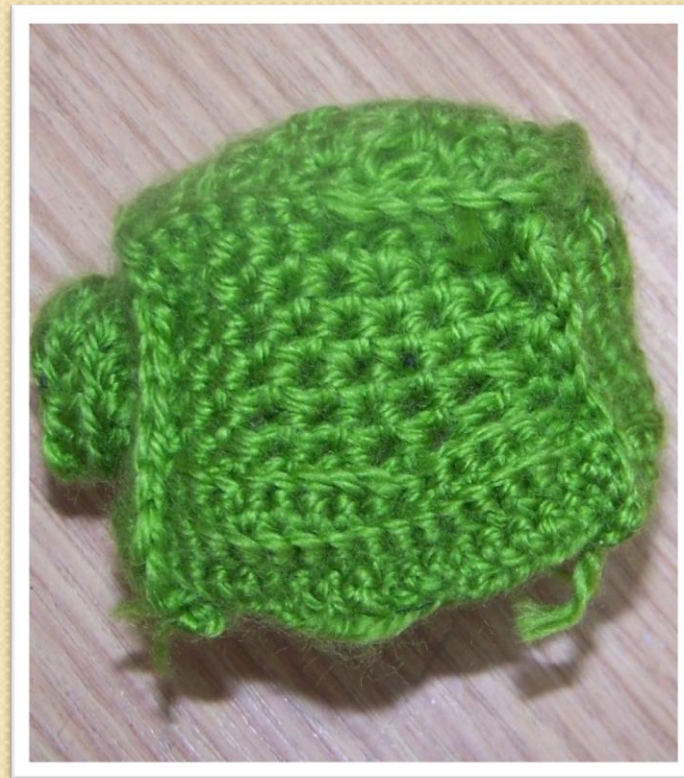
Вязаная башня для корпуса танка