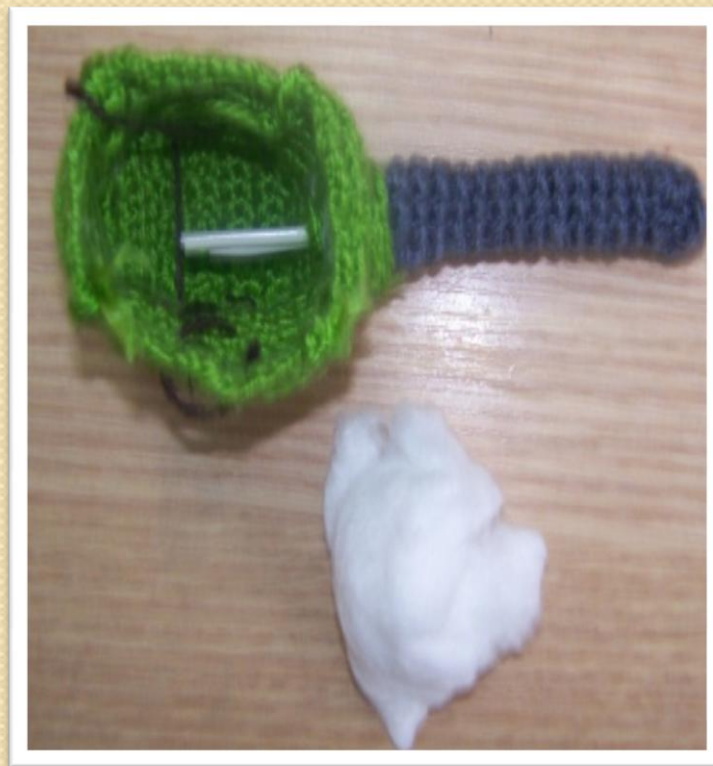
Готовая башня для набивки ватой