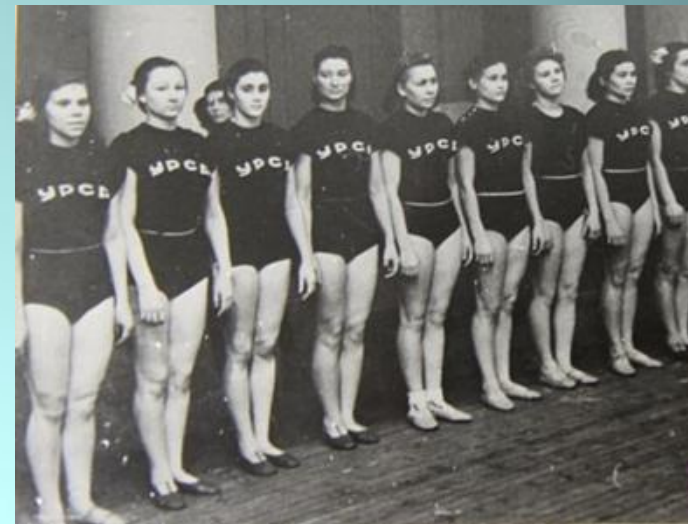
Советские гимнастки 40-х годов