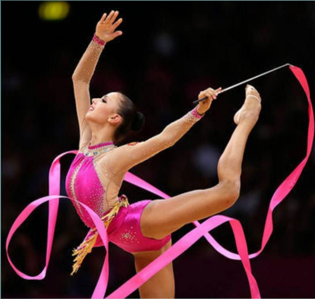
Обычная лента для выступления