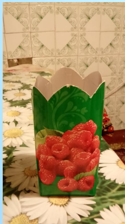
Вазочка для сухих цветов