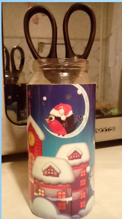
Стаканчик для карандашей