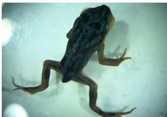
Хвост уменьшается и исчезает.