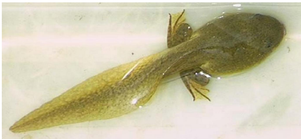
Появление у головастика задних лапок.