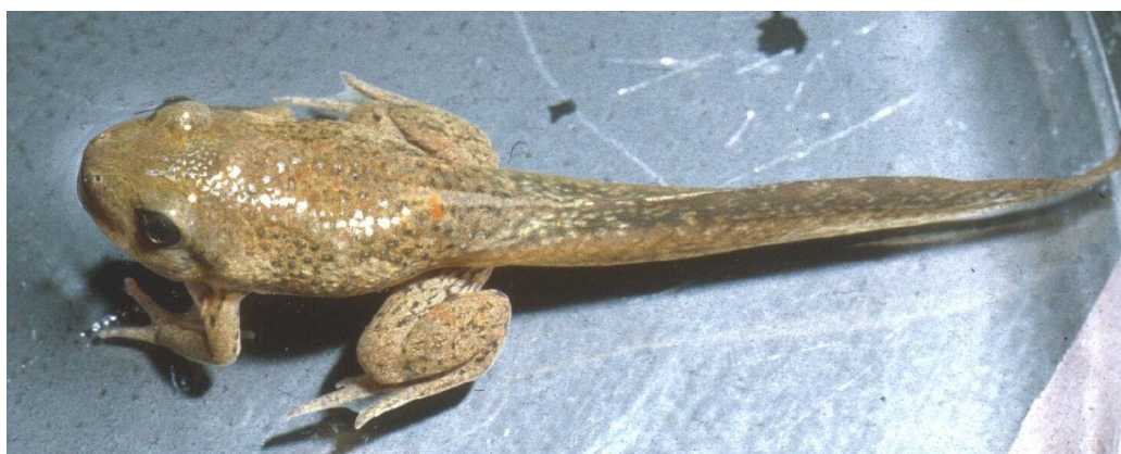
Появление передних лапок. Глаза с боков переходят к верхней части головы и становятся выпученными.