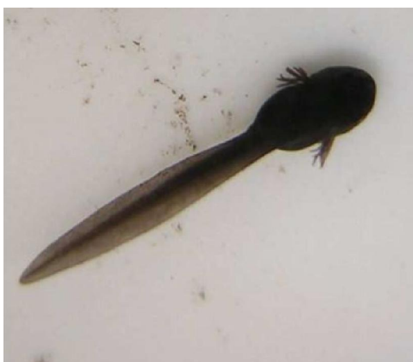
Головастик с наружными жабрами.