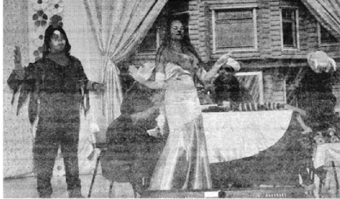
Премьерный показ спектакля «Кошкин дом» в современной обработке

В мае студия «Браво» Центра развития творчества детей и юношества представила на суд зрителей премьерный показ спектакля «Кошкин дом» в современной обработке по пьесе С.Я. Маршак.