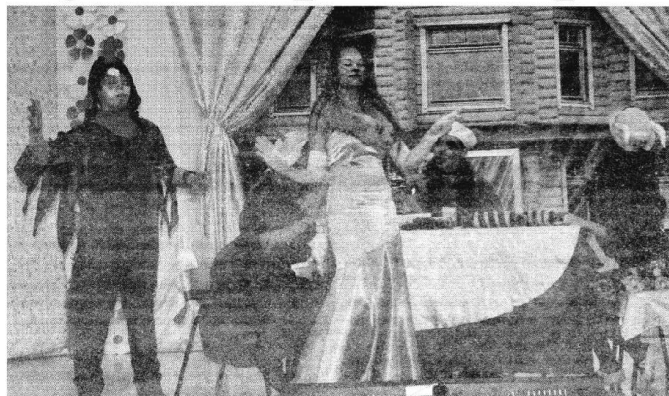
Премьерный показ спектакля «Кошкин дом» в современной обработке

В мае студия «Браво» Центра развития творчества детей и юношества представила на суд зрителей премьерный показ спектакля «Кошкин дом» в современной обработке по пьесе С.Я. Маршак.