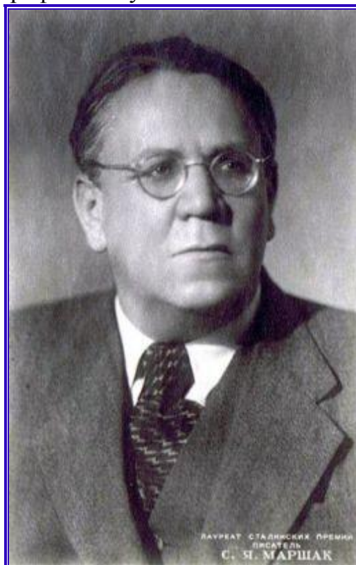
Фотография Самуила Яковлевича Маршака