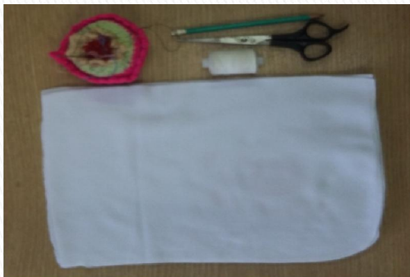
Плотная ткань, ножницы, швейная игла и нитки Старые печатные издания