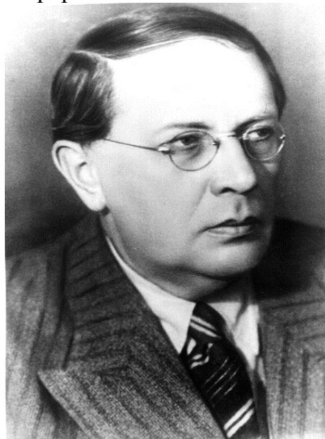
АЛЕКСЕЙ НИКОЛАЕВИЧ ТОЛСТОЙ