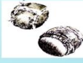
Мяч из бересты