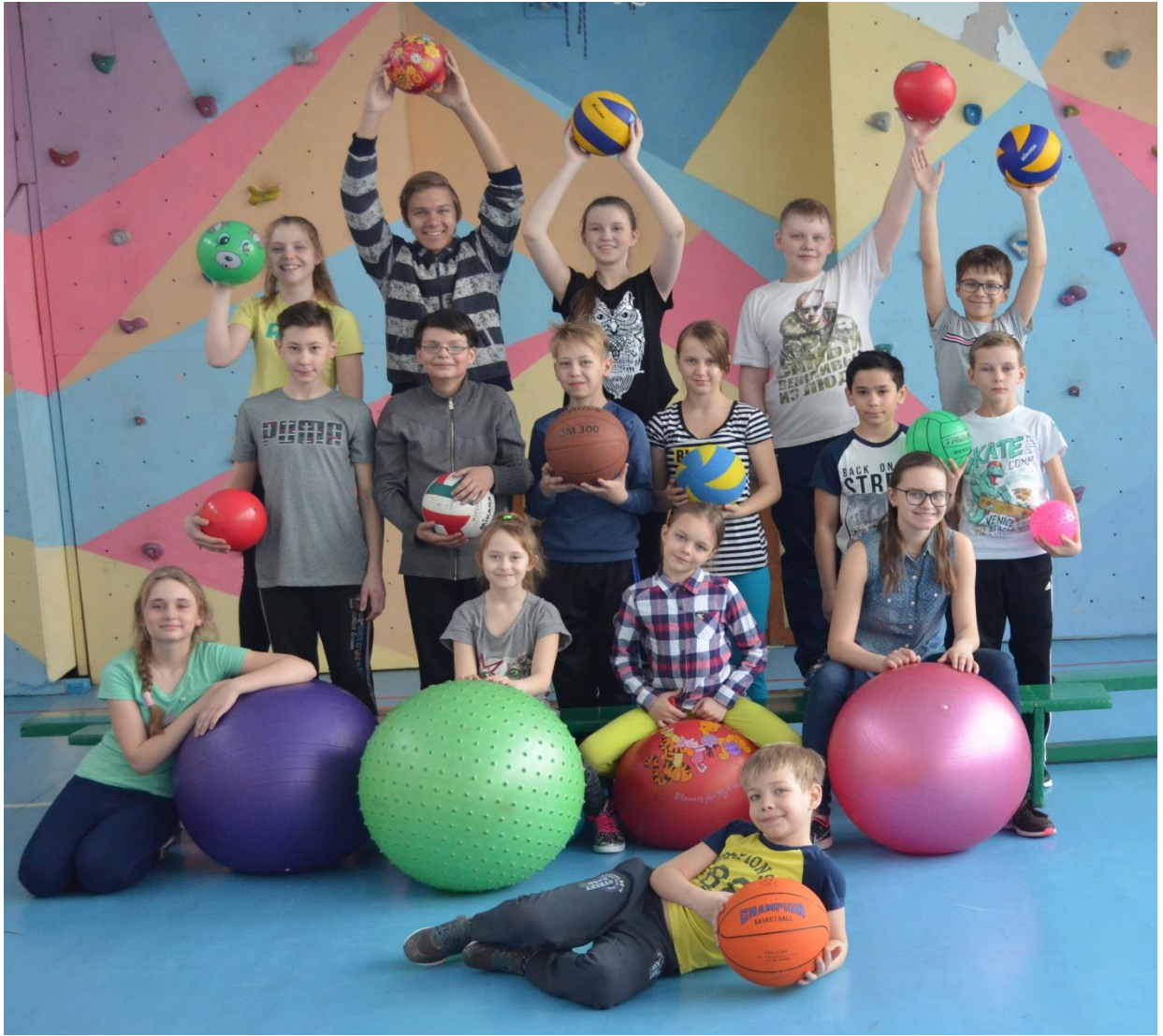
Участники спортивно-познавательного мероприятия «От мячика до мяча»