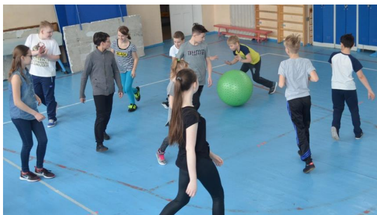
Игра «Снежный ком»