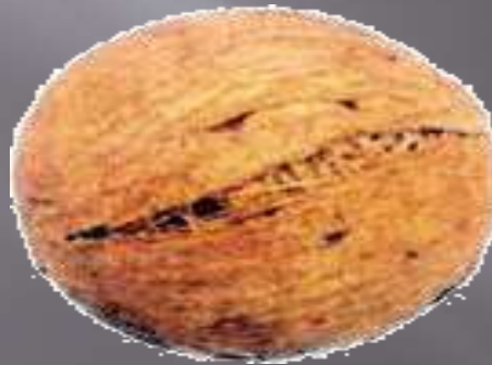
Мяч из травы