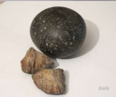
Мяч из камня

Мячи делали из камней, глины, плели из травы, пальмовых листьев, изготавливали из локутов, плодов деревьев, шерсти животных, вырезали из дерева. Позже мячи научились шить из кожи животных, набивая их травой и опилками.