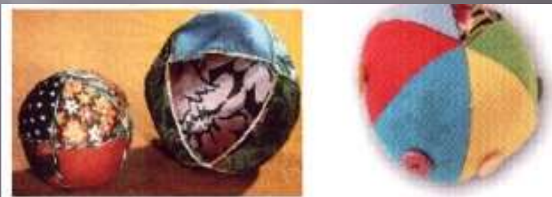
Мячи из локутов