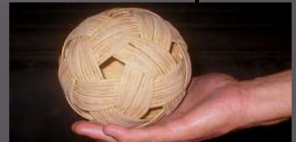
Мяч из тростника