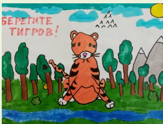
Работа Юзюка Сергея