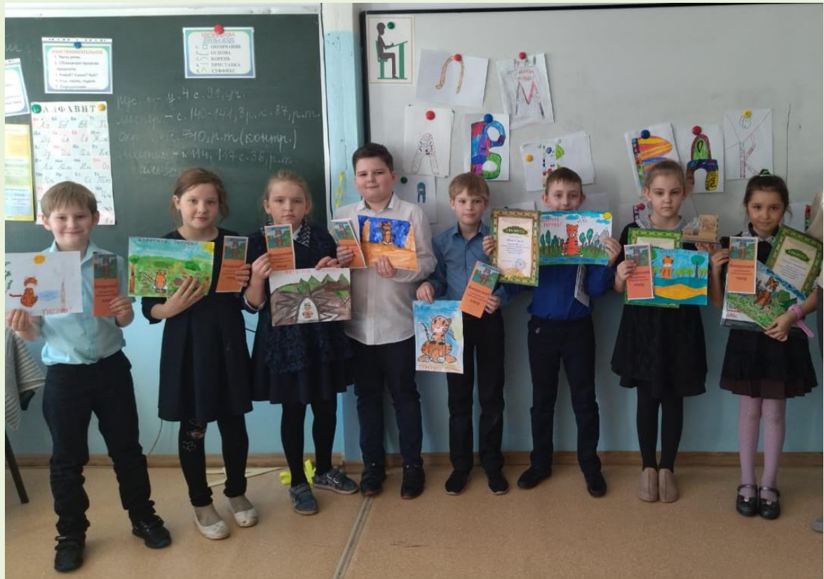
Участники конкурса природоохранных плакатов «Берегите тигров!»